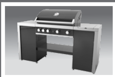
komplettes Island Set